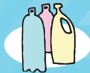
GARRAFA DE PLÁSTICO 100 a 1000 anos