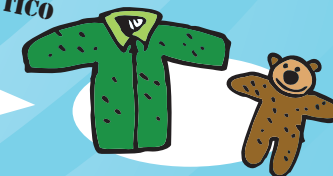
POLARES / CAMISOLAS PELUCHES