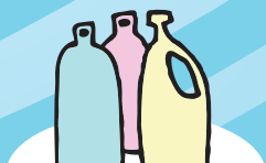
GARRAFAS DE PLÁSTICO