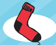
PEÚGA DE LÃ 1 ano