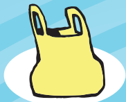
SACO PLÁSTICO 450 anos