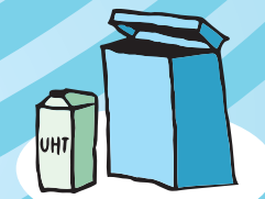
EMBALAGENS DE CARTÃO PAPÉIS