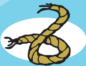
CORDA 3-14 meses