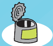
LATA DE CONSERVA 10 a 100 anos