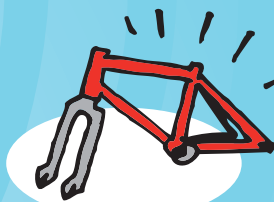
QUADROS DE BICICLETAS METAIS