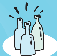
GARRAFAS DE VIDRO